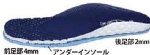
前足部 4mm / アンダーインソール / 後足部 2mm

狭い足幅に対応するため、前後差をつけたアンダーインソールを搭載、“W-Insole”を採用しました。