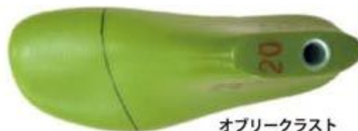
オプリークラスト

JES は、10,000 人以上の子ども達の足を計測しました。調査結果から多くの子どもは足と靴が合っていないことがわかり、さらに、靴が合っていないことが、足のトラブルの一因であることがわかりました。JES は、足計測データを分析し、小学生の足型に合わせた靴型を開発しました。