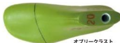
オプリークラスト

JES は、10,000 人以上の子ども達の足を計測しました。調査結果から多くの子どもは足と靴が合っていないことがわかり、さらに、靴が合っていないことが、足のトラブルの一因であることがわかりました。JES は、足計測データを分析し、小学生の足型に合わせた靴型を開発しました。